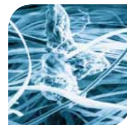
Smuts fångas i mikroskopiska fibernätverk