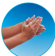
DÉSINFECTION DES MAINS