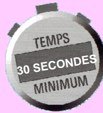
DÉSINFECTION DES MAINS

DÉSINFECTION DES MAINS ENTRE CHAQUE CHAMBRE GANTS NEUFS À CHAQUE CHAMBRE