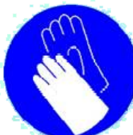
PORT DE GANTS OBLIGATOIRE

Il est conseillé au personnel d'utiliser des gants et de se laver les mains le plus souvent possible. Recommandations susceptibles d'évoluer en fonction des Directives du Ministère de la Santé.