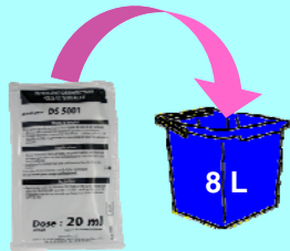
PRÉPARER LA SOLUTION