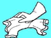
APPLIQUER LAISSER SÉCHER