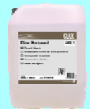
CLAX PERSONRIL 4 KL1