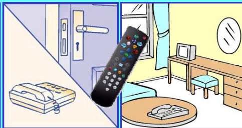
POIGNÉES DE PORTES- TÉLÉPHONE TÉLÉVISEUR – TÉLÉCOMMANDE THERMOSTAT- RADIO - MINI BAR