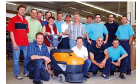
Les collaborateurs du développement, de l'achat, du bureau de préparation, de la production et du contrôle de qualité se réjouissent ensemble du grand succès de la TASKI swingo 450 si maniable.

JohnsonDiversey et grâce à sa maniabilité elle est aussi bien appréciée par nos clients que par nos collaborateurs à la production. 4 à 6 personnes sont occupées tous les jours à assembler la TASKI swingo 450 dans la fabrique de machines. Environ 90 unités quittent la fabrique de machines de Münchwilen chaque semaine, et il faut relever que chaque machine est composée d'environ 350 pièces différentes! On peut être sûr que le succès des TASKI swingo 450 continuera et que la 10 000 ème machine sera bientôt fêtée. Un chaleureux merci à tous les clients qui se sont décidés pour une TASKI swingo 450.