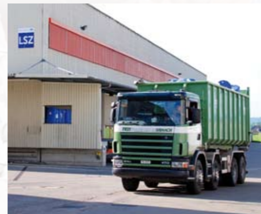
L'année dernière, environ 200 tonnes de matières synthétiques ont quitté Münchwilen pour être recyclées à Eschlikon.

Une grande benne de 35 m 3 quitte presque chaque jour notre site de Münchwilen, remplie à ras bord de bidons et de fûts vides et de pièces en matière synthétique, pour le recyclage chez InnoRecycling à Eschlikon. Les retours des régions du Tessin, Bâle et Lausanne, effectués par chemin de fer, comme les retours des gros volumes, sont collectés par CTW (Camion Transport Wil) et livrés directement.