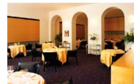
Vue du restaurant «Didier de Courten»

Il faut ajouter une cave à vin avec des vins valaisans sélectionnés ainsi qu'une brasserie «L'atelier Gourmand» où il est possible de découvrir les mets du chef