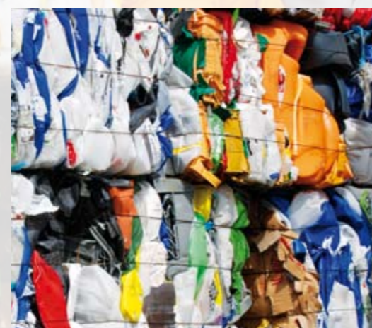
Les réservoirs d'eau oranges des TASKI swingo sont aussi recyclés.

Depuis 15 ans nous offrons à nos clients la possibilité de nous retourner gratuitement les bidons et fûts de produits vides. Il existe différentes possibilités de nous les retourner.