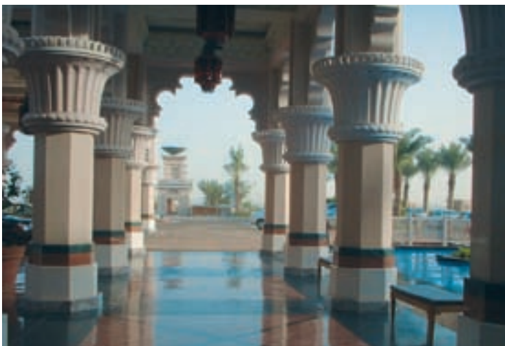
Beach Club of Medinath Jumeira.

Im Nahen, Mittleren und Fernen Osten werden die Einkaufsgeschäfte von Carrefour mit den TASKI-Scheuersaugmaschinen gereinigt. In Shanghai erfolgt die Bodenreinigung zweimal täglich! Linfoot Cleaning, der beauftragte Gebäudereiniger lobt vor allem die Wirtschaftlichkeit und das ausgezeichnete Reinigungsergebnis.