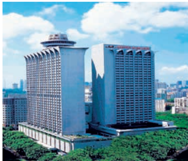
Meritus Mandarin Hotel, Singapore.