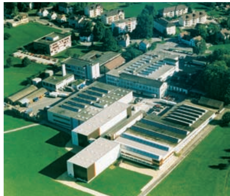
Firmenareal der JohnsonDiversey Münchwilen – vorne rechts die TASKI-Maschinenfabrik.