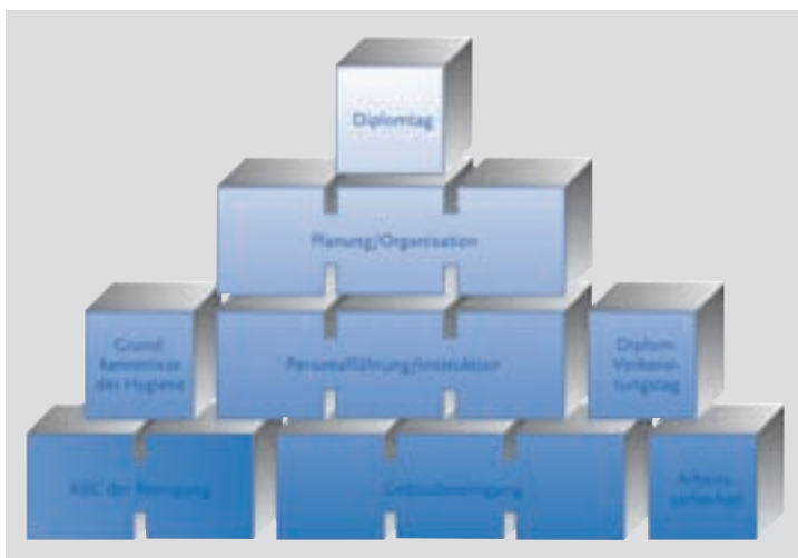
Die Bausteine des Training Center Diplomelehrganges.

Das Training Center braucht es für die Branche. Diese Institution deckt sowohl den fachlichen wie auch den Führungsbereich ab.