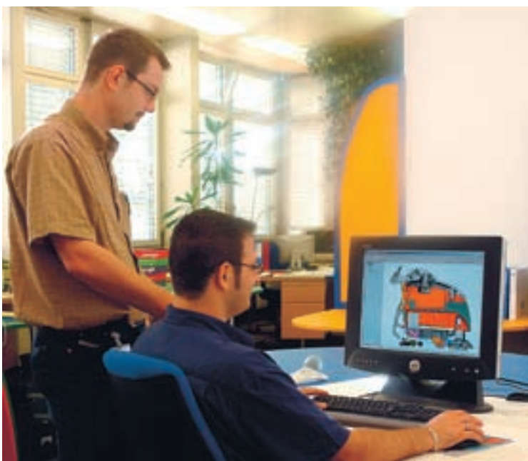
Wir planen heute, was morgen Ihre Arbeit erleichtert.