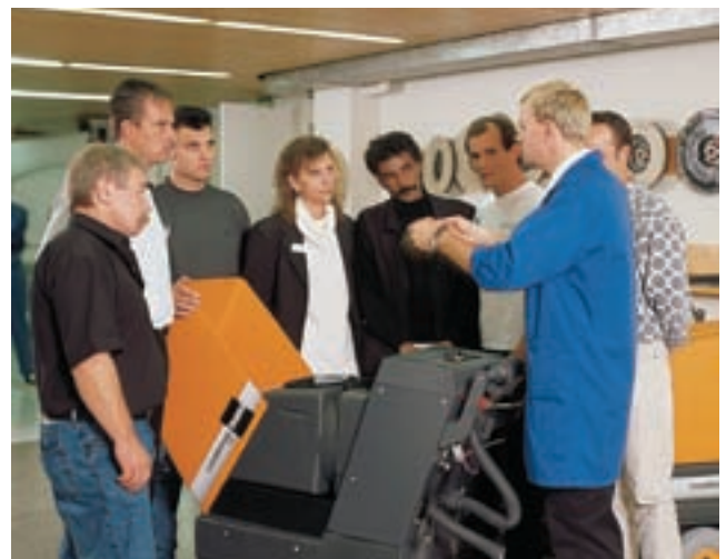
Einführung in die Praxis.