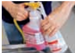
TASKI Sani Cid J-Flex leicht saurer Unterhaltsreiniger für alle Oberflächen im Sanitärbereich