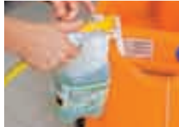
TASKI Jontec 300 J-Flex striemenfreier, neutraler Fussboden- Unterhaltsreiniger