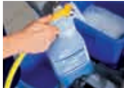
TASKI Sprint Glance J-Flex absolut striemenfreier Oberflächen- und Glasreiniger