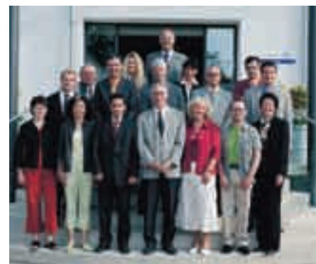
Das Training Center setzt auch auf die Kooperation mit andern Bildungsstätten wie Hauswart-, Berufs- und Hotelfachschulen, wo Kursleiter von JohnsonDiversey als Fachreferenten mitwirken.

Die ausgezeichnete Kursorganisation, die freundliche Atmosphäre und das gute, firmeneigene Gästerestaurant werden von den Teilnehmern seit Jahren sehr geschätzt.