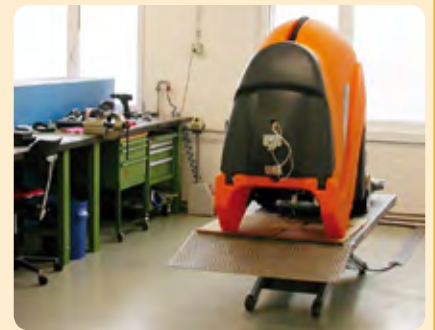
Vue dans les nouveaux locaux de développement des machines TASKI.

Nous sommes convaincus d'avoir créé avec l'extension des capacités de développement les meilleures conditions possibles afin de pouvoir offrir à nos clients des systèmes de nettoyage selon les standards et les technologies les plus récents.