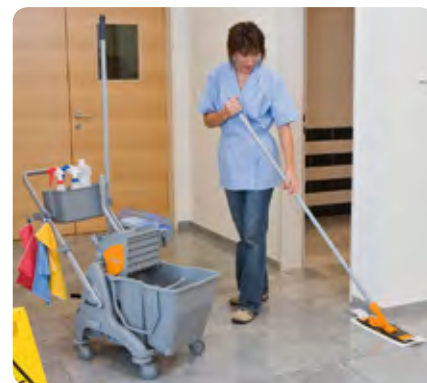
Le système de nettoyage TASKI MicroEasy comprend un chariot à seau double qui offre des surfaces pratiques pour y déposer les produits et les appareils de nettoyage.

Maintenant, les spécialistes de TASKI actualisent l'offre pour le lavage manuel des sols avec le nouveau système de nettoyage TASKI MicroEasy.