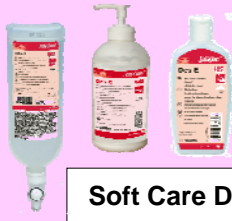
Soft Care Des E