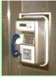
CABINE TÉLÉPHONIQUE + SON ENVIRONNEMENT