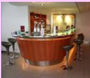
COMPTOIR – TABLES TABLETTES BAR CLIENT