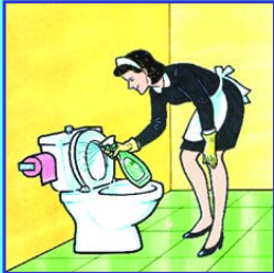
WC - SANITAIRES