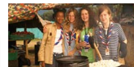
Chaque camp était responsable de la préparation de ses propres plats.

En coopération avec la ZHAW à Wädenswil, notre entreprise a apporté son aide aux 200 cuisines de camp, avec du matériel de formation et des concepts de nettoyage. Pour le nettoyage des cuisines et des installations sanitaires, nous avons utilisé les nettoyeurs TASKI portant le label «Fleur UE» et nous avons lavé dans des conditions hygiéniques le linge de cuisine et le linge hospitalier avec des produits CLAX, inscrits sur la liste RKI.