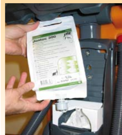
Haute sécurité d'application

• Un nettoyage toujours parfait dans toutes les applications. Une erreur de dosage ou un surdosage sont maintenant exclus.