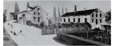
La maison du grand-père et la fabrique, l'année de la fondation en 1858