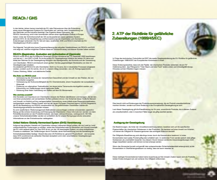
Les deux feuilles d'information au sujet de la réglementation REACH et du GHS sont à votre disposition sur notre site Internet en allemand, français et italien en format PDF.

JohnsonDiversey soutient les objectifs fondamentaux de la réglementation REACH, pour un meilleur contrôle des produits chimiques. En tant que partenaire important dans la chaîne des fournisseurs de substances chimiques, nous nous efforçons d'augmenter continuellement la confiance des utilisateurs. Grâce à notre Global Product Safety Group nous appliquons déjà maintenant des règles très strictes pour les