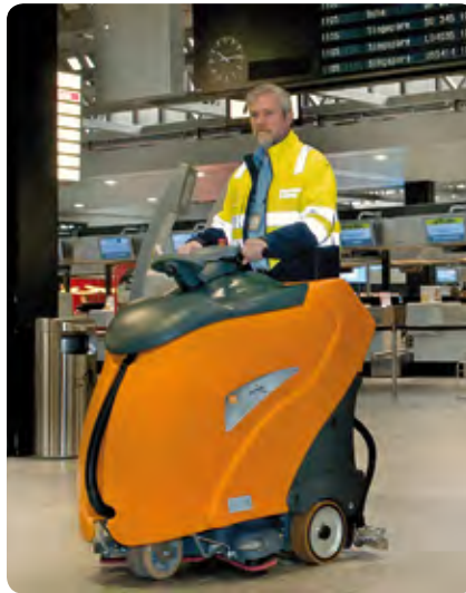
Früher musste immer die Position gewechselt werden, um links oder rechts an der Maschine vorbeischauchen zu können, heute hat man ganz einfach freie Sicht. Alles Faktoren, die die hohe Bedienerfreundlichkeit der TASKI swingo XP unterstreichen.

Mit nur einer Tankfüllung können ohne lästiges Wiederbefüllen bis zu 4000 m 2 an einem Stück gereinigt werden und mit