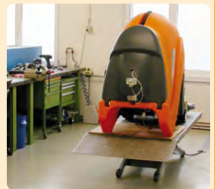
Einblick in die neuen Räumlichkeiten der TASKI Maschinen Entwicklung.

Wir sind überzeugt, dass wir mit dem Ausbau der Entwicklungskapazitäten optimale Bedingungen geschaffen haben, um unseren Kunden Reinigungssysteme nach den neusten Standards und Technologien anbieten zu können.