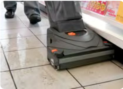
Mühevolle Reinigung kleiner und überstellter Flächen. Sofort trockene Böden!

Die neue Scheuersaugmaschine TASKI swingo 150 ist klein, wendig und eignet sich ausgezeichnet zur Reinigung kleiner und stark überstellter Flächen. Die gereinigten Flächen können sofort wieder betreten werden. Neben der hohen Produktivität bietet die TASKI swingo 150 auch ökologische Vorteile. Sie benötigt bis zu 50% weniger Wasser und Reinigungsmittel als die herkömmliche Reinigung mit Mop und Eimer.