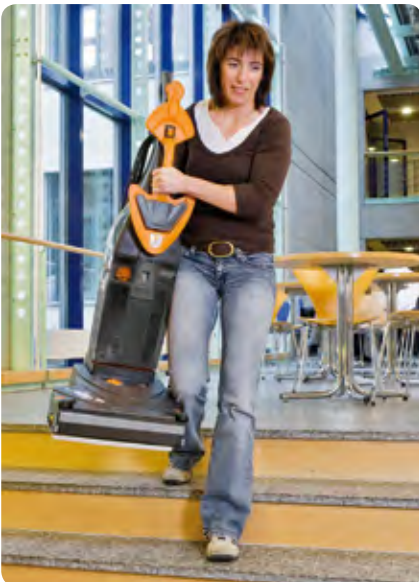
Einfach zu lagern und zu transportieren.

Machen Sie sich selbst ein Bild von den Qualitäten der neuen TASKI swingo 150. Ihr JohnsonDiversey Kundenberater führt Ihnen die Maschine gerne in Ihrem Objekt vor!